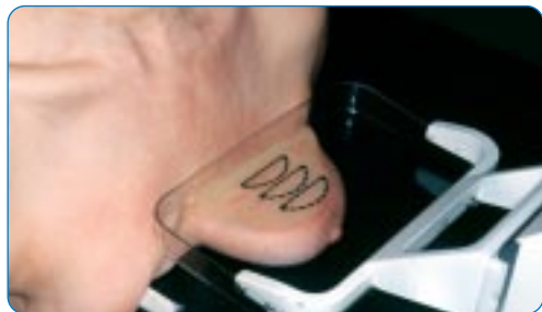
Une mammographie de face

femmes, mais cela ne dure que quelques secondes. La pression du sein est limitée par un mécanisme de sécurité.