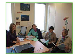
Une commission se réunit le mardi afin d'étudier les demandes d'aide financière.

Une assistante sociale vous aide à anticiper ou faire face aux répercussions sociales de la maladie (accès aux droits sociaux, difficultés financières, besoins d'aide à domicile, logement inadapté à votre état de santé, conséquences sur votre vie professionnelle...).